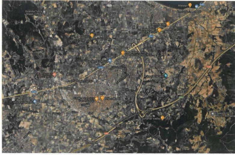
Şekil 1: Urla Merkez

Planlama alanı, idari olarak Urla Kaymakamlığı ve Urla Belediye Başkanlığı yetki alanı sınırları içinde kalmakta olup aynı zamanda İzmir Büyükşehir Belediyesi yetki alanı sınırları içerisinde yer almaktadır.