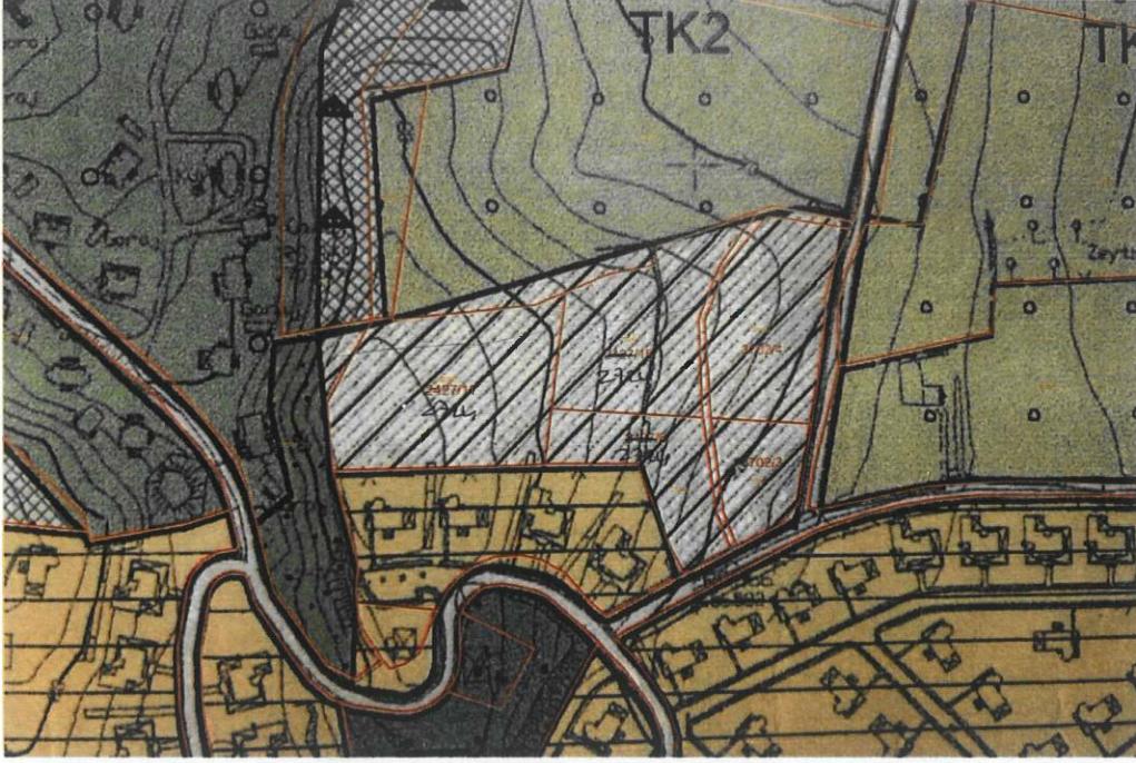
Şekil 3: 1/5000 ölçekli Nazım İmar Planı