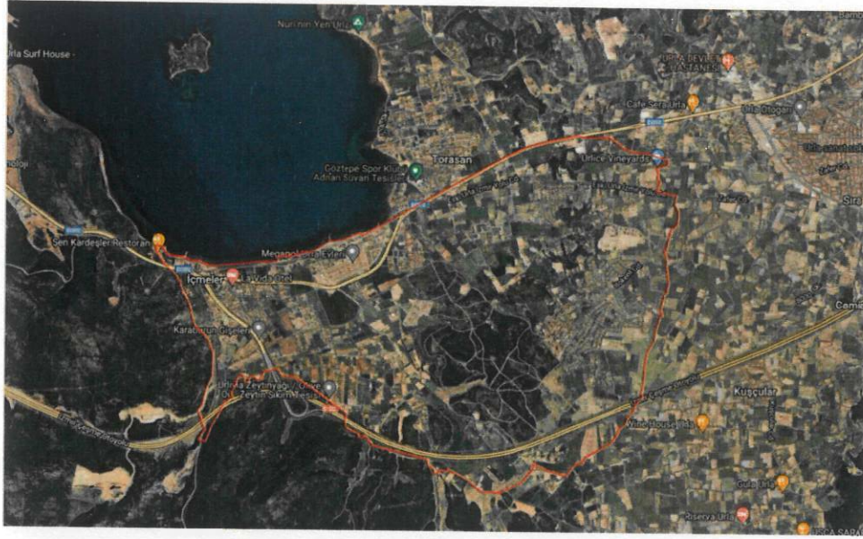
Şekil 1: İçmeler Mahallesi Sınırı

Planlama alanı, idari olarak Urla Kaymakamlığı ve Urla Belediye Başkanlığı yetki alanı sınırları içinde kalmakta olup aynı zamanda İzmir Büyükşehir Belediyesi yetki alanı sınırları içerisinde yer almaktadır.